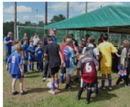
Jugendspieler bei der Siegerehrung.